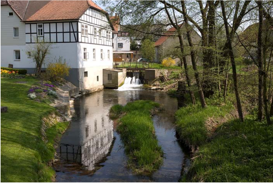
Abb. 3. 4624 Ilse Station 4.1 vor dem Rückbau

Bei Beurteilung dieser Darstellungen in Form von Querbauwerksdiagrammen ist zu beachten, dass viele Querbauwerke aufgrund ihrer Bauwerksart, ihrer geringen Fallhöhe oder auch wegen ihres verfallenden Zustandes als durchgängig angesehen werden können. Insofern überzeichnet die gewählte Darstellungsweise in Säulendiagrammen die bestehende Problematik. Zumindest die registrierten sehr hohen Abstürze mit über 1 m Fallhöhe werden aber in keinem Fall durchgängig sein. Für etliche weitere Bauwerke wie Abstürze über 30 cm Fallhöhe und glatte Gleiten oder Rampen wird das überwiegend auch zutreffen.