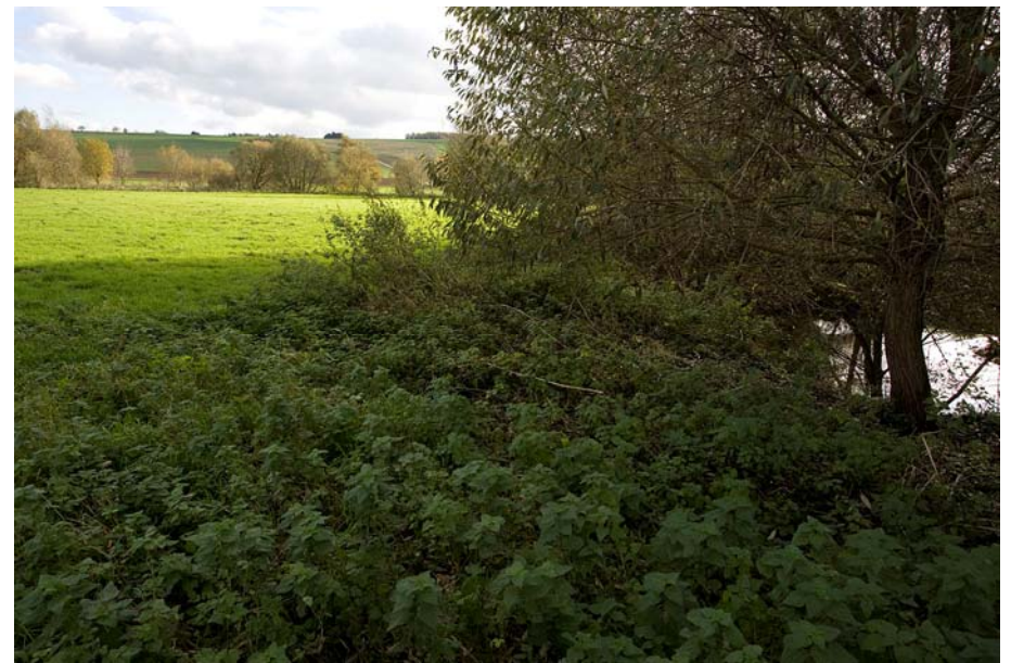
Abb. 9. 456 Emmer Station 45.9 im Jahre 2014

Das Bundesumweltministerium zählt in seiner