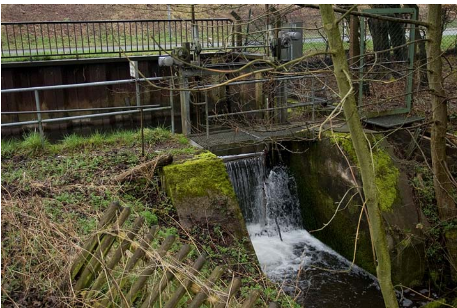
Abb. 1. 4566 Diestel Station 5.1 Stauwehr

Den ersten beiden Beispielgewässern wird nach dem aktuellen Stand des Monitoring (ELWAS, 2014) der gute Zustand bescheinigt. Verschafft man sich jedoch ein Gesamtbild des jeweiligen Wasserkörpers über dessen Gewässerstrukturen oder besser noch über sein BildvomBach , kommen erste Zweifel auf. Diese werden vollends bestätigt, wenn zusätzlich die Situation der Querbauwerke bekannt ist. Der Beitrag des Verfassers in Wasser und Umwelt 8 (Meier, 2013) enthält zufällig das Bild eines Querbauwerks (dortige Abb. 3) im unteren Wasserkörper der Berlebecke, das sich als absolute Wanderbarriere präsentiert. Dieser Bach mündet bei Detmold in die Wiembecke, einem Nebenfluss der Werre. Auch die Diestel, ein Nebenfluss der Emmer in der Stadt Blomberg, weist für Fische unpassierbare Querbauwerke auf, obwohl hier die Bewertung der Fischfauna vorliegt und ein gutes Ergebnis geliefert hat. Abb. 1 zeigt das Beispiel eines solchen Bauwerks, das zusätzlich durch einen ausgeprägten Rückstau mit einer Länge von über 50 m nachteilig auffällt (Abb. 2).