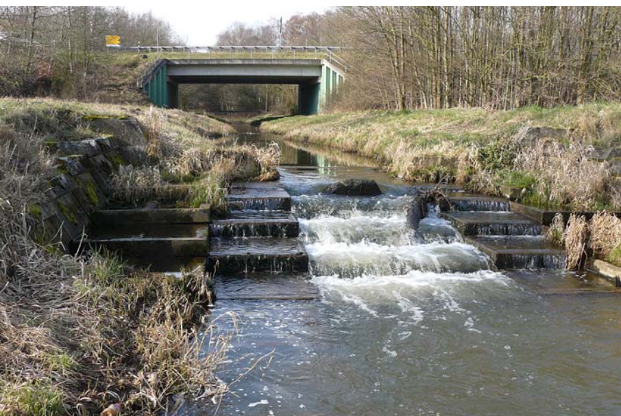
Abb. 5. 4732 Ösper Station 1.1 vor Umbau

Die Gesamtbilanz der Querbauwerke in OWL weist aus, dass zumindest alle 5 km ein Querbauwerk anzutreffen ist, das die Durchgängigkeit behindert. In einem mittleren Abstand von 15 km trifft man auf ein Querbauwerk, das garantiert nicht passierbar ist. Lei-