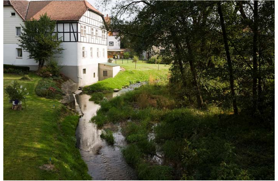
Abb. 4. 4624 Ilse Station 4.1 nach dem Rückbau

der orientieren sich die Prioritäten zur Sanierung der Querbauwerke bisher nicht am bereits erreichten Zustand der Wasserkörper. Zumeist geschieht dort etwas, wo die Rahmenbedingungen den Rückbau gerade ermöglichen. Trotz zahlreicher Einzelmaßnahmen ist daher in der Bilanz des guten Zustandes der Wasserkörper in naher Zukunft kein wesentlicher Fortschritt zu erwarten, da die Verbesserungen nicht konsequent auf den ganzen Wasserkörper erweitert werden. Die Beispiele der Berlebecke und der Diestel haben das deutlich gemacht.