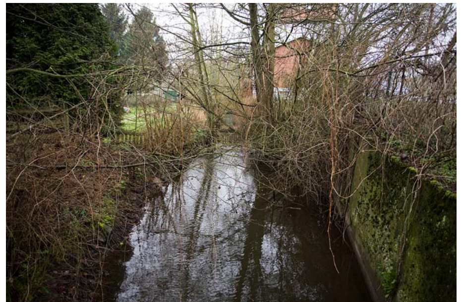
Abb. 2. 4566 Diestel Station 5.1 Rückstau

den gesamten Wasserkörper übertragen werden kann. Der Leitfaden Monitoring Oberflächengewässer des Landes NRW (MKULNV NRW, 2009) sieht für den Fall, wenn das Bewertungsergebnis bei Betrachtung des Wasserkörpers nicht plausibel erscheint, im kommenden Monitoringzyklus eine erneute Untersuchung, ggf. an einer besser geeigneten Messstelle oder ein investigatives Monitoring vor. Vor solchen aufwendigen Untersuchungen sollte aber erst einmal die Behebung offensichtlicher Mängel im Wasserkörper vorrangig sein. Ein derartig konzeptionelles Vorgehen ist aber noch nicht zu erkennen. Die Freude über eines der wenigen guten Messergebnisse führt zu dem Fehlschluss, dass für den zugehörigen Wasserkörper kein Handlungsbedarf mehr gegeben ist.