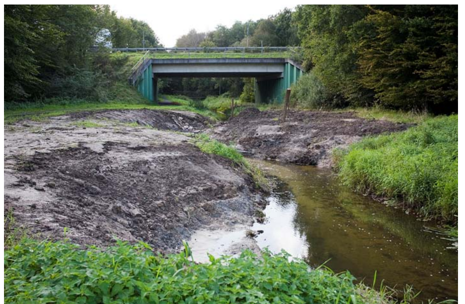
Abb. 6. 4732 Ösper Station 1.1 beim Umbau

Die Ortsheimatpflege Petershagen gab im Jahr 2008 ein Jahrbuch heraus, das sich mit den Auswirkungen des Gewässerausbaus auf die bäuerlich Kulturlandschaft kritisch befasste (Fieselmann, 2008). Im Zusammenhang mit der Herausgabe des Buches widmete sich eine mehrwöchige Ausstellung der Historie des Flusses und den aktuellen Erfordernissen aufgrund der WRRL. Neben der Ortsheimatpflege beteiligten sich die BUND-Ortsgruppe, die Kulturgemeinschaft und die Stadt selbst an dem Projekt, das da-