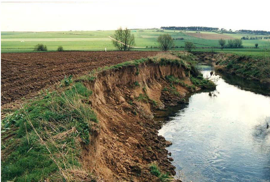
Abb. 8. 456 Emmer Station 45.9 im Jahre 1990

nach der WRRL unterliegen, wird aber auch hier das Ziel nicht so schnell zu erreichen sein, wie es die Fristen in der WRRL erfordern.